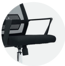
Asiento en espuma laminada