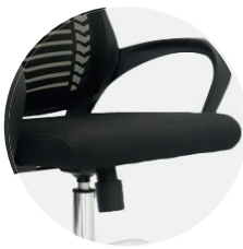
Asiento en espuma laminada