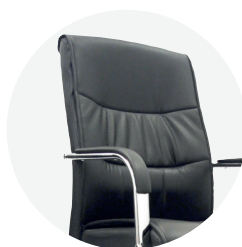
Espaldar en cuerina