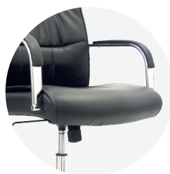
Asiento en cuerina