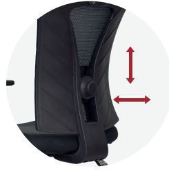
Soporte lumbar regulable