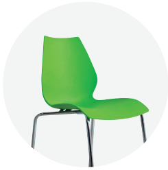
Concha plástica En pp